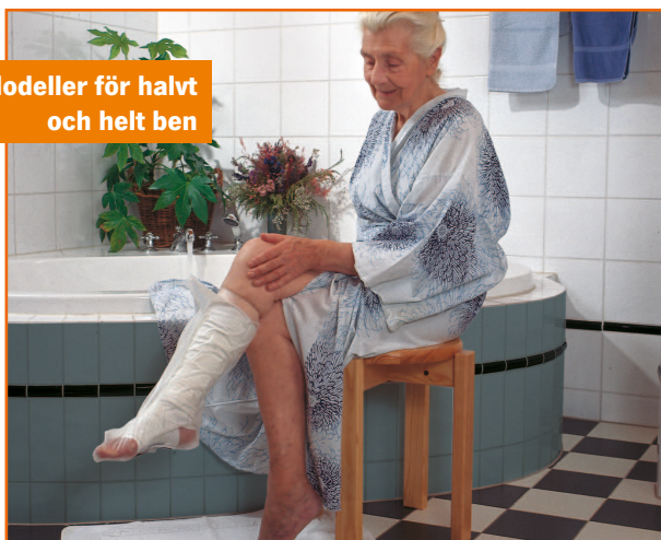
Modeller för halvt och helt ben

Sätt AquaProtect över bandaget/gipset och du har ett 100 % vattentätt skydd.