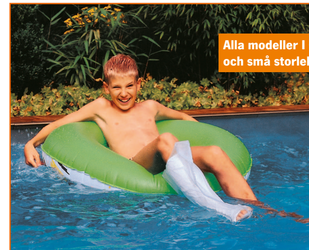
Alla modeller i stora och små storlekar.

AquaProtect skyddar ditt bandage/gips, var du än är: I duschen, badet, poolen eller havet.