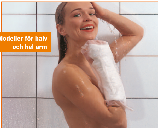
Modeller för halv och hel arm

AquaProtect gör ditt liv med gips så mycket enklare och bekvämare.